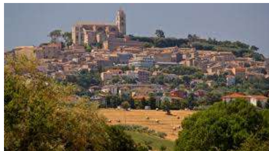
(Fermo): FermoInAcquarello (Central Venue)