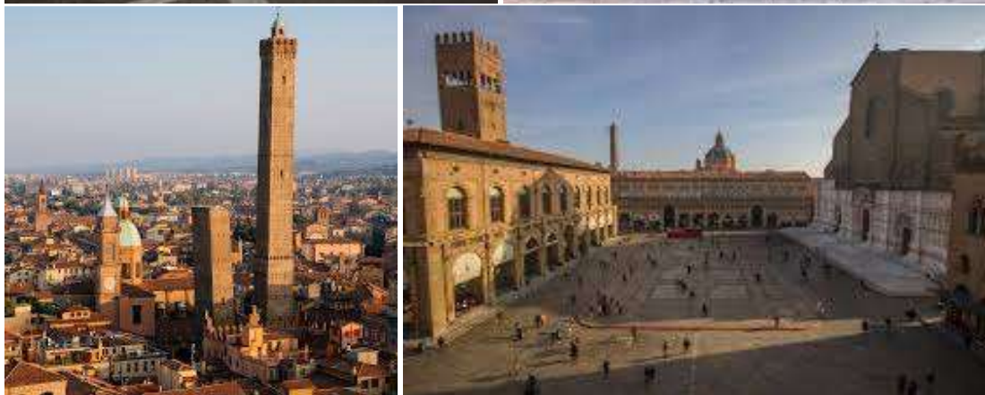
Bologna - photos are from 2025 edition